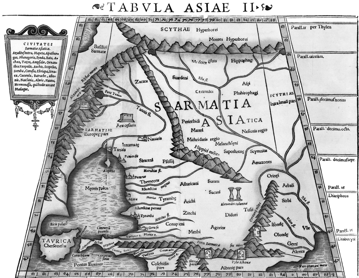
Рис. 1. Tabula Asiae II – Sarmatia Asiatica по данным Клавдия Птолея немецкого картографа Себастьяна Мюнстера (Sebastian Münster) 1552 г. (Basel: Heinrich Petri)

равнские горы и устье реки Соана на границе с Албанией ( Ptolem. V.8.5–6,9, V.11.1 ). Последние приоритетно отождествляются соответственно с северо-восточными отрогами Большого Кавказа и р. Сулак [1, с. 117–119; 2, с. 32–34], к северу от которой, по Птолемию ( Ptolem. V.8.6 ), протекали реки Алонта (совр. р. Терек), Удон (совр. р. Кума) и Ра (совр. р. Волга).