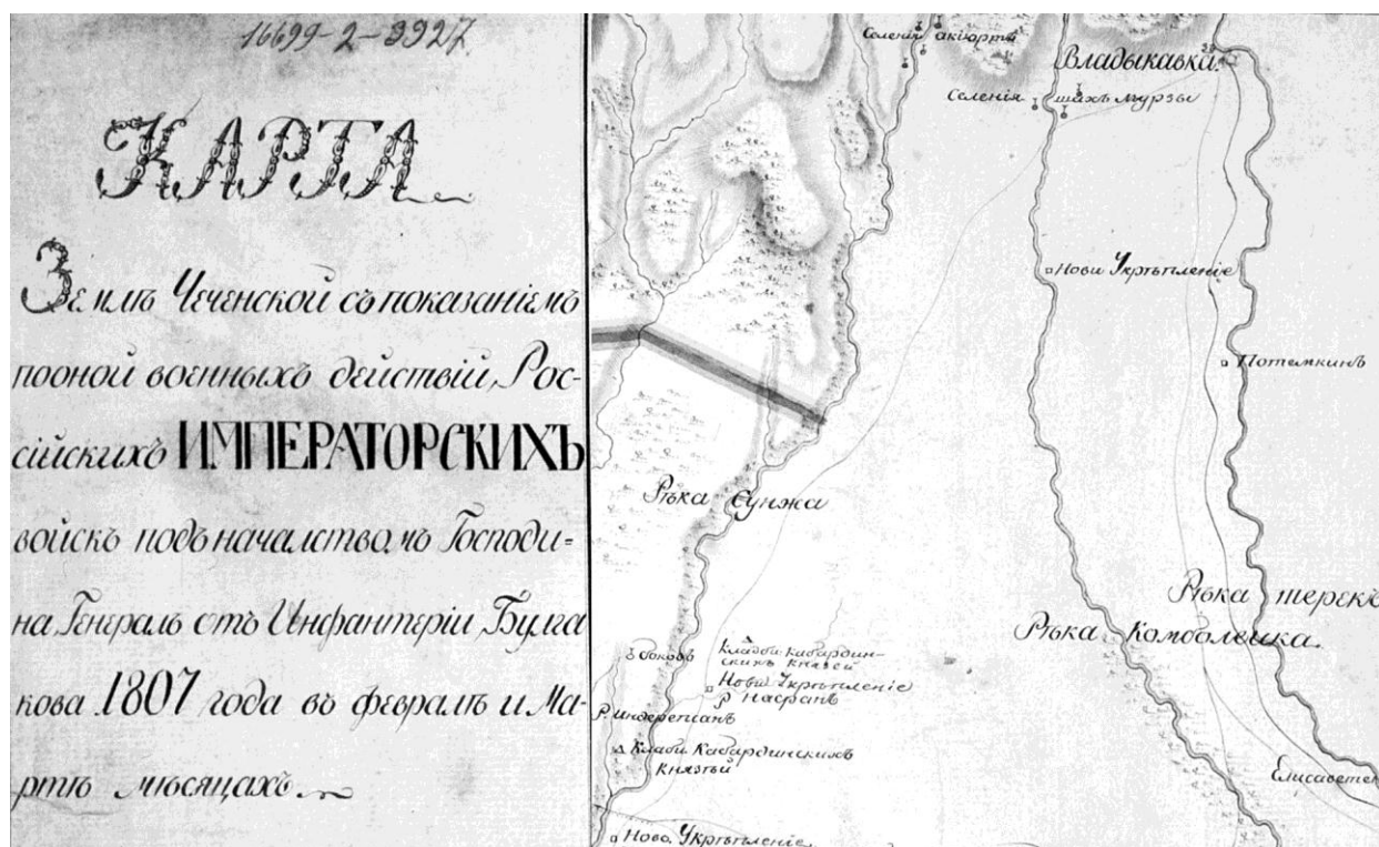
Рис. 1. Фрагмент карты начала XIX в. с указанием селений Ших-мурзы [РГВИА. Ф. 846. Оп. 16. Д. 6716. Л. 1]

Кстати, осетины, переселившиеся в Дарьяльское ущелье из Алагирского ущелья в самом начале XVIII в., платили ингушам «за пользование землей», на которой находились селения Ларс, Чми и Балта. Усилившись, осетины перестали платить ингушам за аренду, но еще 30 лет, до 1790-х гг. платили «малокабардинским князьям Мударовым» [4, с. 128]. Согласно Е.Н. Кушевой, источники позволяют проследить с XVI в. зависимость некоторых ингушских обществ от кабардинских феодалов. В качестве примера исследовательница приводила факты контроля Дарьяльского ущелья мурзами (князьями) Малой Кабарды, принадлежавшими к роду Клехстана (вышеуказанные Алкас и его сыновья Айтек и Мудар) [2, с. 166, 305].