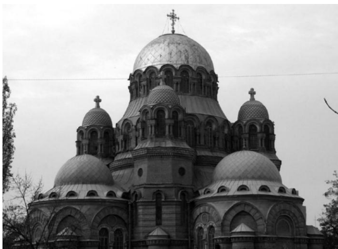
Знаменский собор г. Хасавюрта. [1, с. 125]

В дагестанском городе Хасавюрте на улице им. Тотурбиева возвышается величественный Знаменский собор – крупнейший православный храм на Северном Кавказе. Храм строился в 1903–1904 гг. и был приурочен к 300-летию дома Романовых.