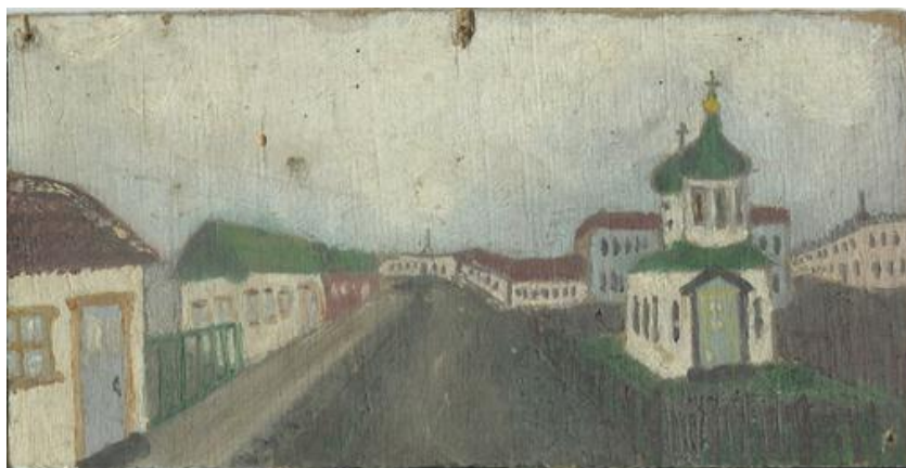
Н.В. Дробышев. Слобода Хасавюрт. Начало XX в.

В конце XIX в. в слободе существовала только военная церковь, принадлежавшая последовательно Кабардинскому, Ширванскому и Лорийскому полку [8]. До 1894 г. в слободе не было прихода, поэтому ее жители молились в этом храме.