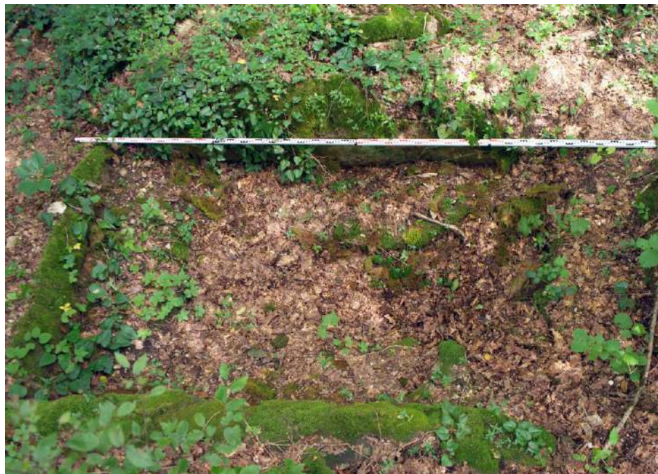
Рис. 1. Каменный ящик у с. Азанта

каменном ящике писал Ю.Н. Воронов [3, с. 38 (№ 253)]. Нами была осуществлена фотофиксация обоих памятников. Следует заметить, что облик Азантского дольмена не изменился по прошествии почти 100 лет после его открытия. Это можно заметить при сравнении рисунка из публикации М.М. Иващенко [7, с. 11 (рис. III)] и фото 2022 г. (рис. 2).