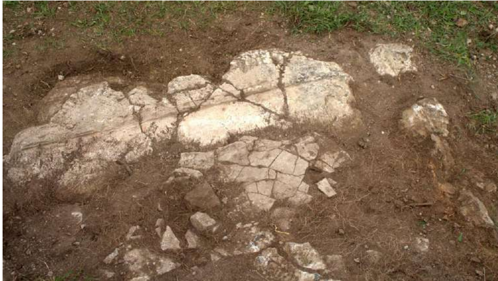
Рис. 3. Недостроенный дольмен у с. Цабал. Паз, сделанный в плите. Вид с юга

Осмотр окрестностей и с. Георгиевское Гулрыпшского района и опрос местных жителей показал отсутствие на этой территории дольменных памятников или их остатков.