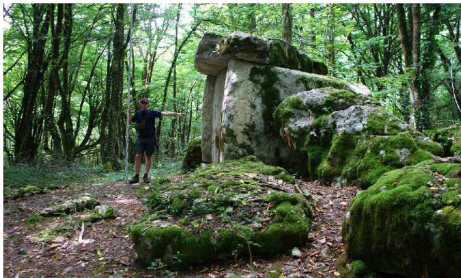
Рис. 2. Азантский дольмен. 2022 г.

Эшерская группа дольменов была открыта в 1930 г. М.М. Иващенко. На момент исследования их насчитывалось не менее 15 [7, с. 14]. К большому сожалению, из них нам удалось обнаружить остатки лишь 5 дольменных памятников. На все развалы дольменов нам указали местные жители, за что приносим им большую благодарность. На изменения внешнего вида древних памятников, неудовлетворительную сохранность и состояние указанных дольменов большое влияние оказывают антропогенные воздействия. В с. Верхняя Эшера они разрушены в результате человеческой деятельности, остатки их