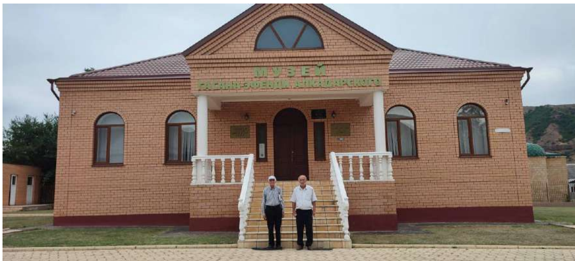
Музей Гасана-эфенди Алкадари в с. Алкадар Сулейман-Стальского района Республики Дагестан. Июль 2025 г.

праздника был зажаренный в хлебной печи барашек («бирганд»). В последующие годы черешневые сады в селении были выкорчеваны и праздник больше не проводился. Такой же праздник проводился и у табасаранцев с. Черс Хивского района, на который так же приезжали гости из соседних районов [20, с. 106–109]. Праздники черешни у лезгин и табасаранцев укрепляли традиционные добрососедские отношения между дагестанскими народами.