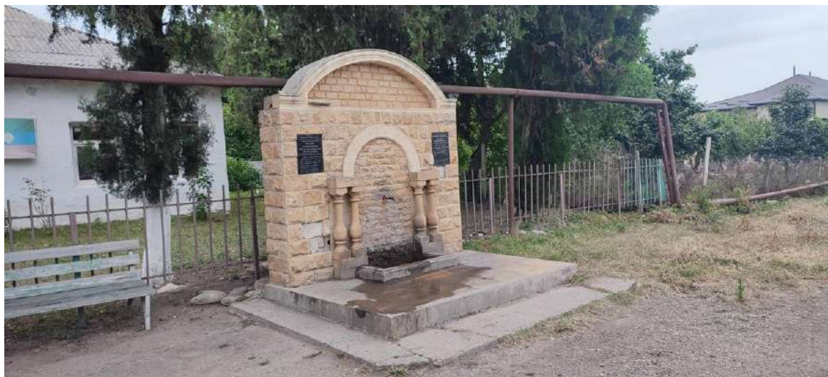
Природниковоое сооружение в с. Алкадар Сулейман-Стальского района Республики Дагестан. Июль 2025 г.

Начиная с 2000 г. в последнюю субботу июня в с. Ахты, а с 2021 г. и в с. Касумкент проводится фольклорный праздник Шарвили 5 , посвященный лезгинскому эпическому герою.