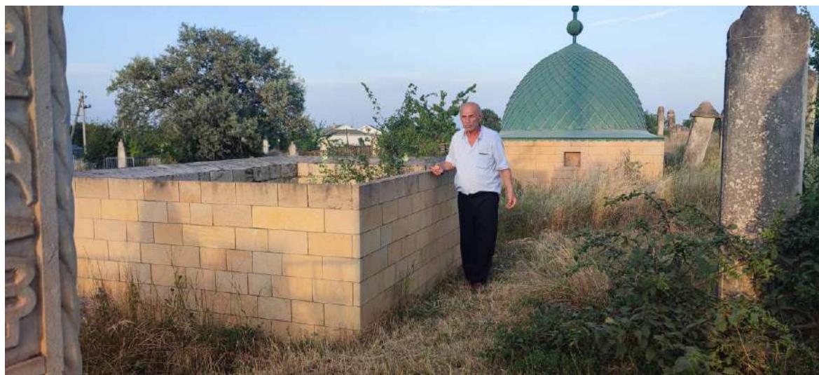
Культовое сооружение «пир» на кладбище с. Юхари-Стал Сулейман-Стальского района Республики Дагестан. Июль 2025 г.

На 1 января 2025 г. в с. Юхари-Стал насчитывалось 547 хозяйств, в которых проживало 1 940 человек. В селении имеется открытый еще в 1966 г. ФАП, построенная в 2007 г. средняя общеобразовательная школа (СОШ) на 260 учащихся и возведенный в 1990 г. детский сад на 100 мест. Природный газ в селение провели в 1995 г., а проводной интернет – в 2010 г.