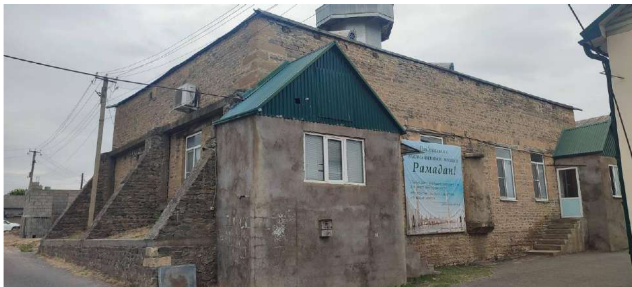
Мечеть с. Ашага-Стал Сулейман-Стальского района Республики Дагестан. Июль 2025 г.

Несмотря на то, что еще в советское время питьевая вода была проведена по трубам в каждый дом, в селении сохраняются старинные общественные источники («булахар»): Хурук-булах, Къарасуд-булахар, Жинеррин кунтун клане авай булахар, Тайибан булах, Бедеван-булах, Келед-булах, Къазан-булах, Латарин-булах, Нацлан-булах, Цайар цин булахар, Гъажид вирин, Гугурт квай булах, Стал вацун кьере авай булахар [11, с. 57].