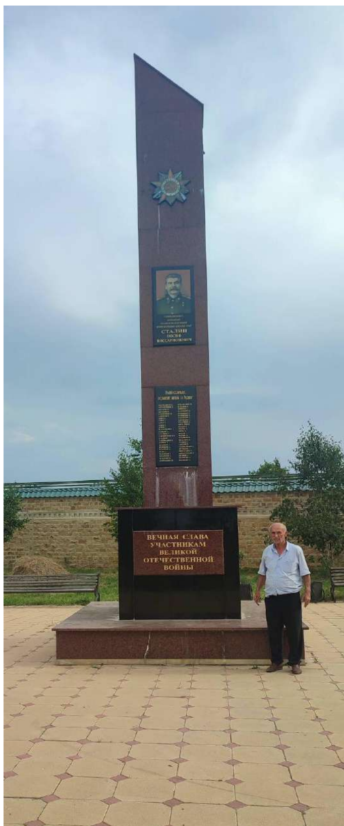
Обелиск павшим в Великой Отечественной войне 1941–1945 гг. жителям с. Юхари-Стал Сулейман-Стальского района Республики Дагестан. Июль 2025 г.

Раньше в селе было два больших фруктовых сада в местностях «Пирерин вякъ» («Священная трава») и «Фекъидин куът» («Сад [принадлежащий] мулле»), которые после образования колхоза в 30-х гг. XX в. стали колхозными садами, а в 1966 г. – совхозными.