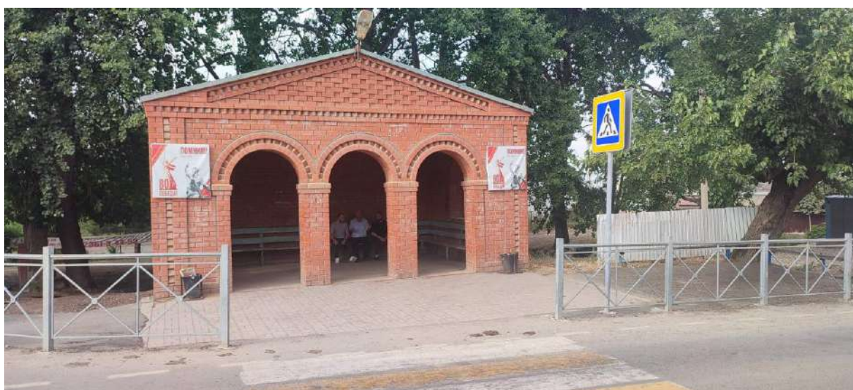
Крытый годекан («ким») в с. Юхари-Стал Сулейман-Стальского района Республики Дагестан. Июль 2025 г.